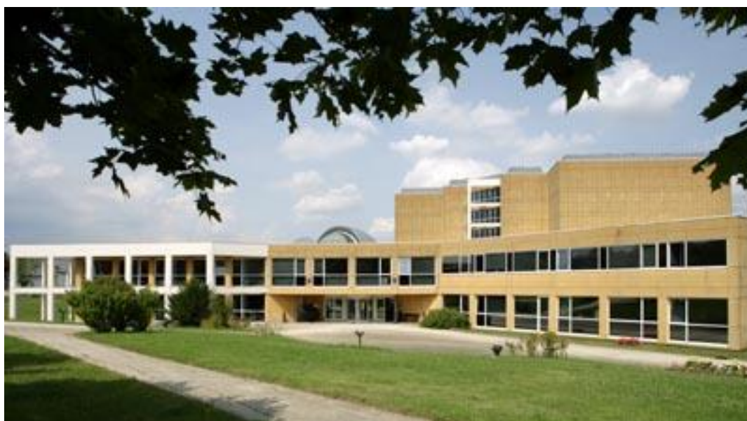
Le bâtiment moderne date de 1991

Nous sommes partis à 7h 30 en prenant l'autoroute, 165 km nous séparent de notre but.